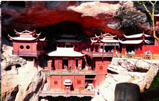
图 2 福建的甘露寺