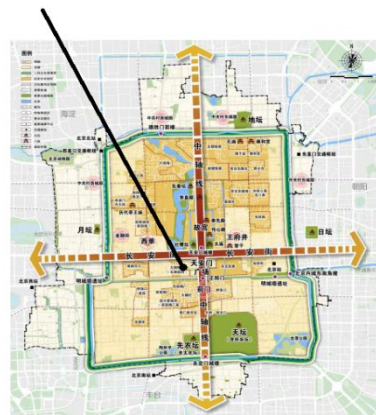
图5 某社区在北京的位置

某社区地处北京核心区范围内，距天安门仅1.5千米。其所处的这个地区的功能定位是全国政治中心、文化中心和国际交往中心的核心承载区，是历史文化名城保护的重点地区，是展示国家首都形象的重要窗口地区。该社区历史遗留问题较多：人口密度大，绿化少，车位严重不足，部分楼至今仍使用临时电，地下空间违法群租存在安全隐患，违建圈占绿地现象严重。街道将街区整理列为重点，全面启动社区整治改造工程，包括小区绿化、市政设施维护等。