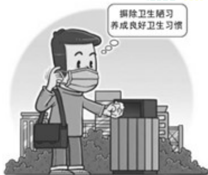
图 3 讲卫生 重小节

8. 读图 3。文明的细节是一个城市软实力的最美表情。在公共场所咳嗽、打喷嚏时遮掩口鼻，得了流感佩戴口罩……这些行为被写进《北京市文明行为促进条例（草案）》（属于法律文件）。这表明向不文明行为说“不”，可以