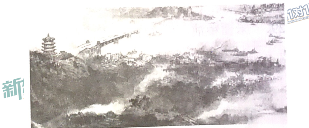
图 11 《长江万里图》局部

26. 万古奔腾的长江，孕育着源远流长的中华文明。为全面展示新时代长江的自然风貌和文化景观，多位艺术家深入长江流域采风，创作了巨幅长卷《长江万里图》。该作品雄浑磅礴、风光万千，画出了一条中国人心中砥砺奋进的文化长河。《长江万里图》的创作